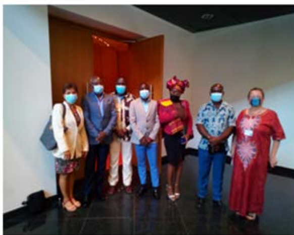
Actividad Archivo Nacional de Angola 5 de mayo, día del Patrimonio Africano. (2021)